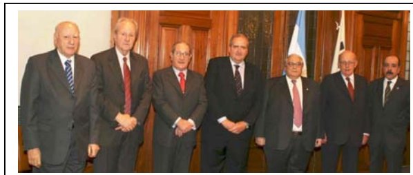
El Ministro Daniel Filmus reunido con Presidentes y representantes de las 7 entidades empresarias, en el acto de entrega del documento.

Si desea conocer el documento entregado al Ministro Filmus, no dude en solicitárnoslo vía e-mail.